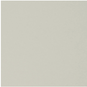
Taralay impression 1092 UNI MATT LIGHT BEIGE