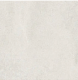
Taralay impression 1026 CEMENTO ROMA

Proposition de sol souple - Classement U2SP3