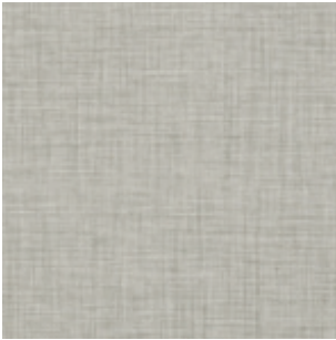
Taralay impression 1064 FINESSE NA- TURE